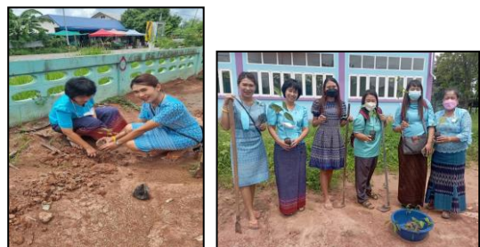
ปลูกป่าเฉลิมพระเกียรติ โรงเรียนชนนโคกท่า/บ้านนาเพียง/บ้านหมอดแอ