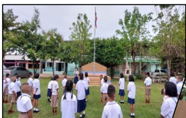
กิจกรรม หน้าเสาธง