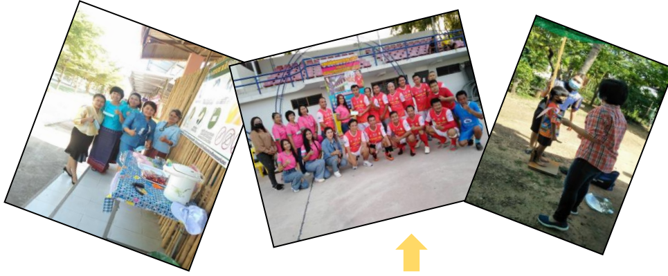
ปฏิบัติงานที่ได้รับมอบหมาย