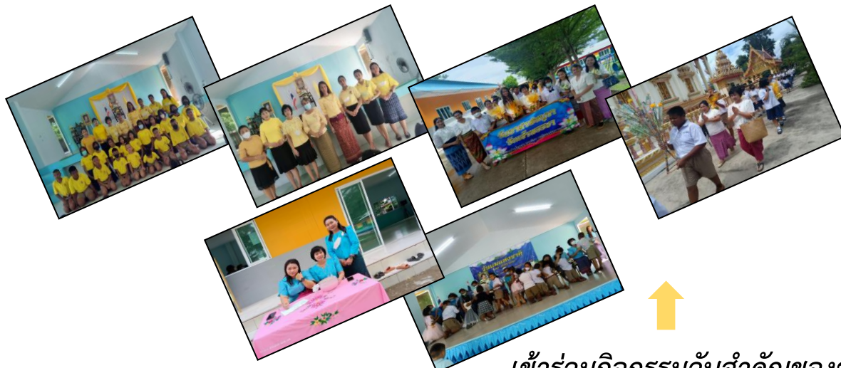
เข้าร่วมกิจกรรมวันสำคัญของชาติ ศาสนา พระมหากษัตริย์