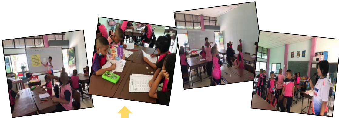
การจัดบรรยากาศในชั้นเรียน