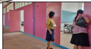
โรงเรียนบ้านโคกท้าว/บ้านนาเพยง/บ้านเหมือดแอ่ฯ